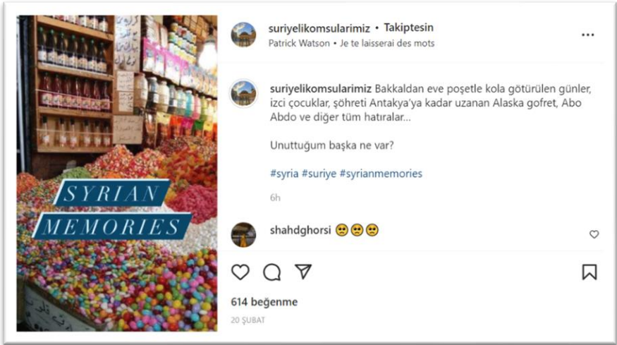
Şekil 6. Suriye kültürüne ait paylaşımlar-2

Yiyecek ve içeceklerin hem kültürel belleğin açıklanmasında hem de geçmişin hatırlanmasında önemli bir yeri vardır. Yiyecek ve içecekler, içeriğindeki tüm malzemelerin üretimi, sunumu ve tüketimi ile kültürden bağımsız değildir. Ayrıca yemek bireysel ve toplumsal hafızanın açığa çıkmasında da önemli bir rol oynar.