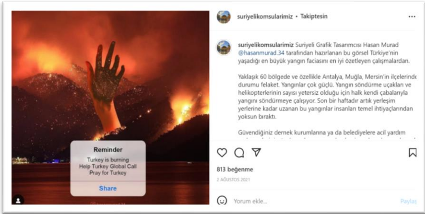
Şekil 2. Türkiye'deki Yangınlarla ilgili paylaşım

etmektedir. Kullanılan müzikler Arapça'nın yanısıra farklı dillerde de (Fransızca, İngilizce gibi) olmaktadır.