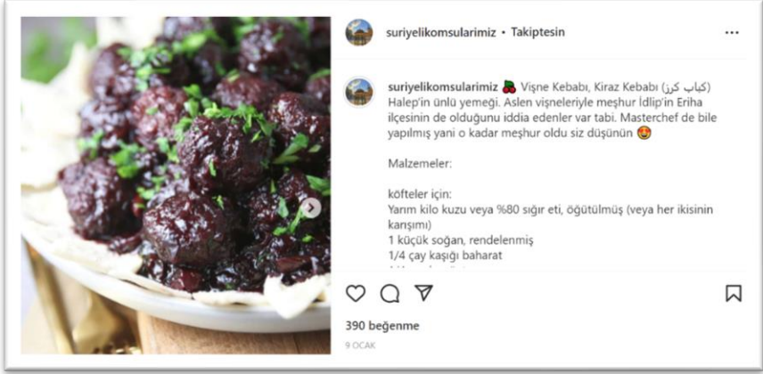
Şekil 5. Suriye kültürüne ait paylaşımlar-1