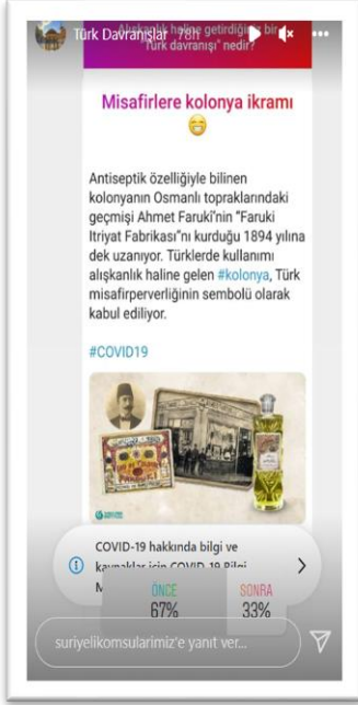
Şekil 9. Türk kültürüne dair paylaşım-1