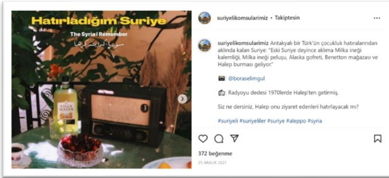
Şekil 8. Geçmişin hatırlanması ve o günlere özlem içeren paylaşım-2

Geleneksel eşyalar, hatıralar hatırlamanın geride kalan ile bağ kurmanın aracıdır. Bu bazen bir fotoğrafta, bazen bir eşyada karşımıza çıkar. Geçmişten bir nesne ile bağ kurma Connerton'un (2014) da vurguladığı gibi unutmama ve tüketme üzerine kurulu bir sisteme direnmenin ve kendini hatırlamanın da bir yoludur.