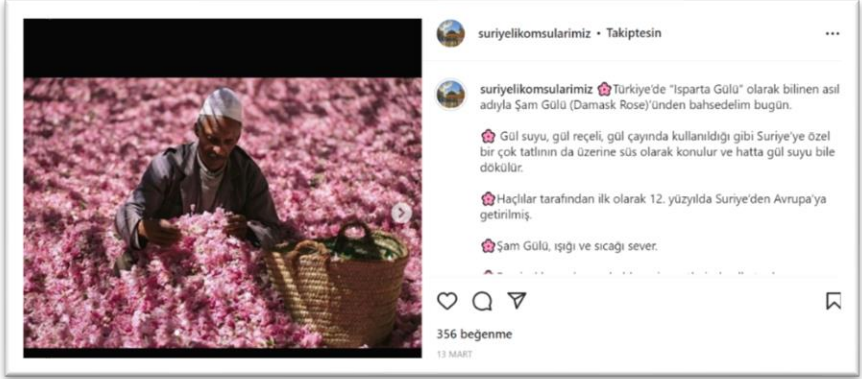
Şekil 4. Türk ve Suriye kültürünün kesiştiği noktalara dikkat çeken paylaşım