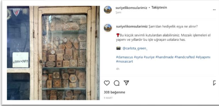
Şekil 7. Geçmişin hatırlanması ve o günlere özlem içeren paylaşım-1

Hendrich (2020) yemeğin ve içeceğin hem bireysel hem toplumsal hatıralara işaret edebileceğini, hem de bireysel hatırlamanın uyarıcısı ve nesnesi olabilir derken başlı başına hatırlamada yemeklerin önemine vurgu yapar.