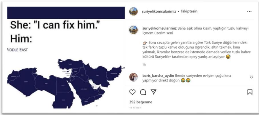
Şekil 3. Türkiye ve Suriye düđünlerine ilişkin paylaşım

toplumdaki ahlaki deęerleri ortaya ıkarmaktadır. “Bařkası” ve “ben” toplumun ayna da olan bir yansımasına benzetilmektedir. Levinas da kuvvetli olan bir olma, bütünü paraları olma duygusu “Suriyeli Komřularımız” Instagram hesabında paylaşılan gönderilerde görülebilmektedir. Aynı olmak kategorisi altında incelediđimiz içerikler, Türk ve Suriye kültürünün aslında birbirlerinden etkilendiđini göstermeye, aralarında ortak bir paylaşımın olmasına yöneliktir. Paylaşımların içerikleri genel olarak komřu olan bu iki ülkenin dini bayramları, gelenek-görenekleri, beslenme şekilleri, benzer tarım kültürlerinden oluşmaktadır.